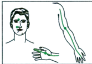
Боли в области уха

Точечный массаж снимает блоки и восстанавливает циркуляцию энергии Ци в меридианах.